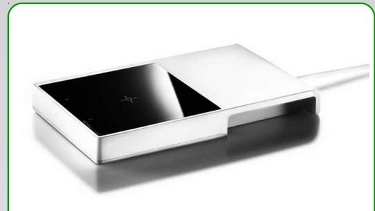
Der NFC-Reader für das Modul MT Zerano . Dieser wird per USB an einen Windows-Rechner oder den MT Harvester angeschlossen.

MT Zerano kann auch unabhängig von MT als Standalone-Programm installiert werden.